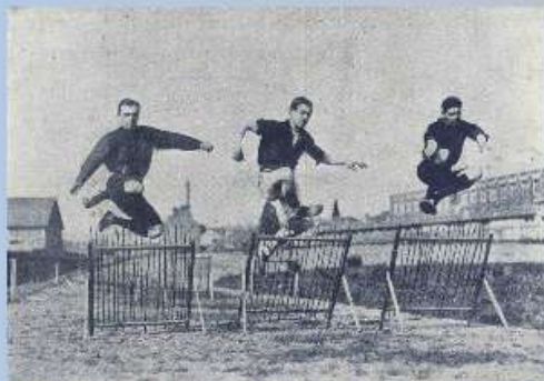
Une série du 110 mètres haies à Fervacques lors d'épreuves athlétiques organisées par l'Union Sportive des Amicales de Lisieux, La Revue illustrée du Calvados, octobre 1909

En 1892, Pierre de Coubertin inaugure à Caen les « lendits normands ». Ces rencontres athlétiques inter-lycées remportaient un vif succès malgré les critiques de médecins qui considéraient le sport mauvais pour la santé des adolescents ! En août 1894, lors du congrès de l'association française pour l'avancement des sciences à Caen, il prononce un discours qu'il qualifie de « Bataille de Caen » pour témoigner de son combat pour convaincre des bienfaits du sport et de la nécessité de renouer avec la tradition des Jeux Olympiques. Ce sera chose faite en 1896 à Athènes. Les Jeux de Paris, en 1900, voient le couronnement du premier Calvadosien champion olympique : Joseph Lecornu (1864-1931) dans la discipline du... cerf-volant !