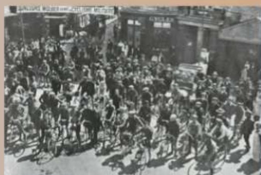
Les concurrents de l'éliminatoire du Grand Prix Wolher de cyclisme militaire avant le départ de la course à Lisieux, La Revue illustrée du Calvados, juillet 1912

Après la guerre de 1870 contre la Prusse, le gouvernement, persuadé que l'absence de culture gymnique en France a favorisé la défaite, forme des bataillons scolaires. En 1907 des sociétés de tir sont créées dans toutes les écoles publiques. La Fédérale du Calvados, fondée à May-sur-Orne en 1907, organise des concours de tirs le jour de l'examen du certificat d'études primaires. En 1914, le Calvados compte 42 sociétés de tir.