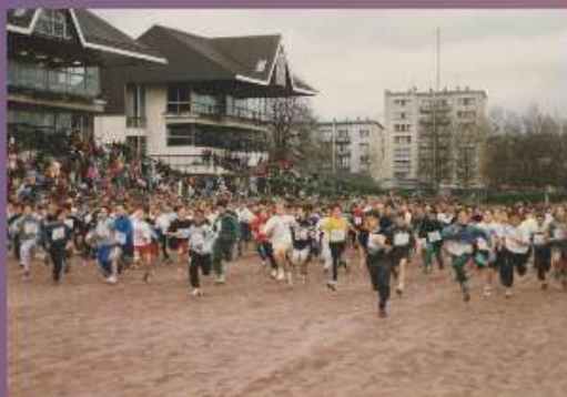
Cross du Conseil général du Calvados sur l'hippodrome de la Prairie de Caen en 1996

Le Marathon de la Liberté est créé. Il associe depuis 2002 une course caritative, La Rochambelle, qui promeut le sport au féminin tout en soutenant la lutte contre le cancer du sein. 800 femmes s'alignaient lors de la première course-marche avant de devenir une «vague rose» de 25 000 femmes dix ans plus tard !