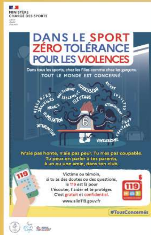
Affiche de prévention du Ministère des Sports, 2020

La loi de 2015 vise à protéger les sportifs de haut niveau et à sécuriser leur situation juridique et sociale : « Les sportifs, entraîneurs, arbitres et juges sportifs de haut niveau concourent, par leur activité, au rayonnement de la Nation et à la promotion des valeurs du sport. »