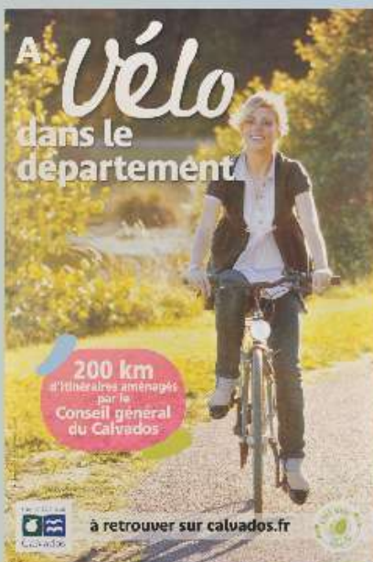
Affiche du Conseil Général du Calvados promouvant la pratique du vélo, 2012

Les Archives du Calvados mènent un travail de collecte auprès des clubs du département pour préserver leur patrimoine et permettre l'écriture de l'histoire du sport calvadosien. Nous remercions chaleureusement ceux qui nous ont déjà fait confiance et sommes à l'écoute de vos propositions.