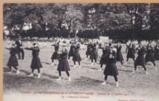
Cartes postales de la 37 e fête fédérale de gymnastique à Caen, 15 juillet 1911