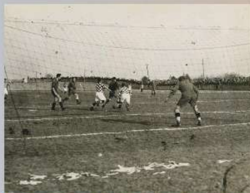
Match de football entre le Stade Malherbe de Caen et le Stade Havrais au stade Venoix, vers 1930

Au cours du 20 e siècle, la démocratisation du sport, sa féminisation et sa professionnalisation sont autant d'expressions de profondes transformations sociales.