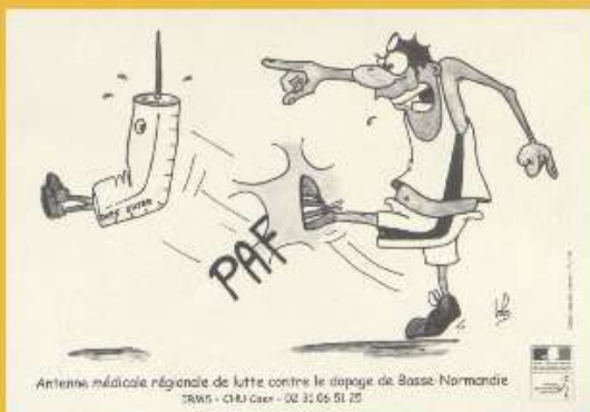
Antenne médicale régionale de lutte contre le dopage de Basse-Normandie 2001 - CHU Caen - 02 31 05 51 25