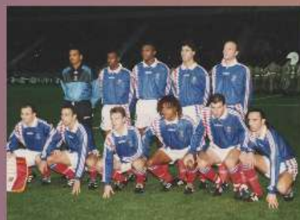
Photographie de l'équipe de France de football au stade Michel d'Ornano de Caen, 1995