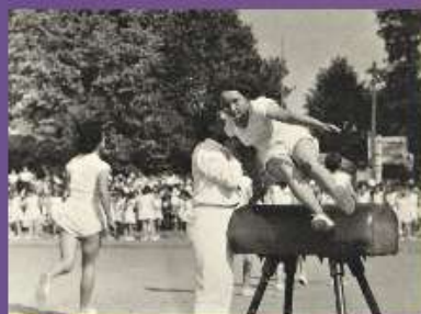
Fête de la jeunesse sur le stade Héllitas à Caen. 29 juin 1952

Pentathlon (Stade Malherbe) : 1950 championne d'Europe