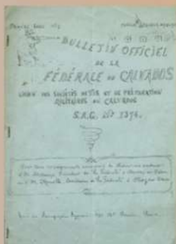
Bulletin officiel de la Fédérale du Calvados, Union des Sociétés de tir et de préparation militaires du Calvados, 1 er trimestre 1913