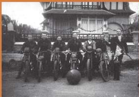
L'équipe du Moto-ball Club d'Houlgate le jour de la création du club, 1934

Football (CMC) : l'un des meilleurs attaquants normands avec 40 buts durant la saison 1908-1909