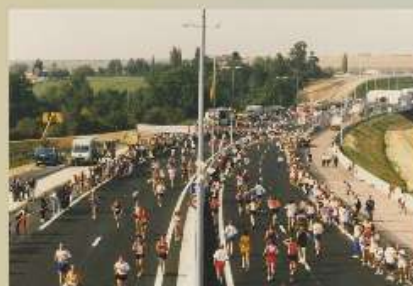
Boude du périphérique à Caen en 1992

Trop longtemps lié institutionnellement exclusivement à la jeunesse, l'enjeu de la pratique sportive investit ainsi l'ensemble de la société.