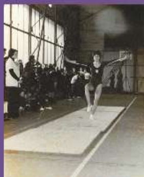
Gymnaste de l'Avant-Garde Caennaise vers 1980

Le sport reste malgré tout soumis aux stéréotypes de genre et les femmes doivent continuer à combattre sexisme, inégalité de salaire et d'intérêt médiatique ainsi que considérations esthétiques sans rapport avec leur pratique sportive.