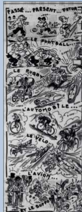
Passé, présent et futur du sport illustrés dans le journal Sports-Ouest, 29 décembre 1950