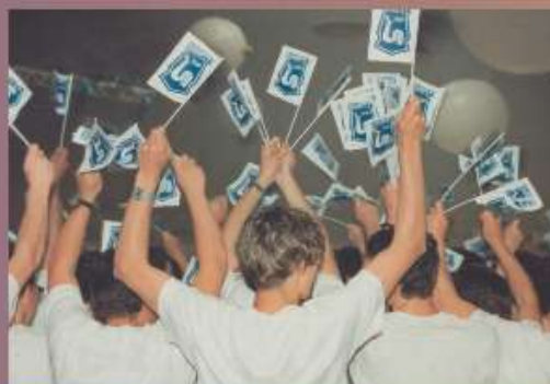
Photographie de l'ASPTT de Caen aux premiers Jeux Nationaux des ASPTT en 1994 à Orléans

Les lois se succèdent pour favoriser les pratiques sportives ainsi que le sport scolaire.