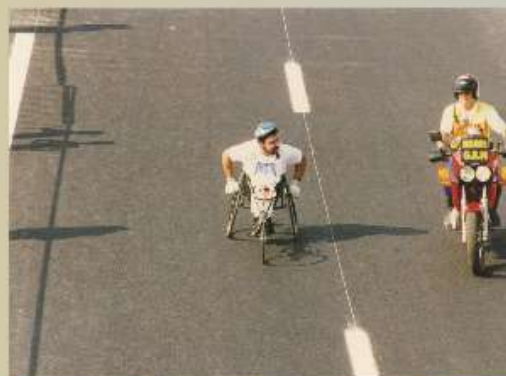
Athlète handisport participant à la boude du périphérique à Caen en 1992

Tennis fauteuil : participe aux Jeux Paralympiques de Rio en 2016 en tennis fauteuil.