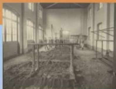
Salle de gymnastique de l'École Normale d'Instituteurs de Caen (actuel rectorat, rue Caponière), 1930

Certains sports restent longtemps inaccessibles au plus grand nombre : les premiers Jeux Olympiques d'hiver à Chamonix en 1924 ne suscitent guère d'engouement... et une différenciation sociale se maintient durablement selon les disciplines.