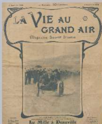
Épreuve de quadricycle de la coupe de Deauville, 8 septembre 1901

EXPOSITION RÉALISÉE EN 2022 PAR LES ARCHIVES DÉPARTEMENTALES DU CALVADOS Commissariat d'exposition : Maxence Philippe Graphisme : Anaïs Blanc-Gonnet