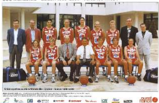
Poster de l'équipe de l'USO Mondeville Basket, saison 1999-2000