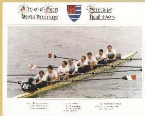
Équipe des vétérans de la Société Nautique de Caen et du Calvados lors d'une course sur la Tamise en 1995.

Natation : championne du monde de sa catégorie d'âge en 2012 à 91 ans !