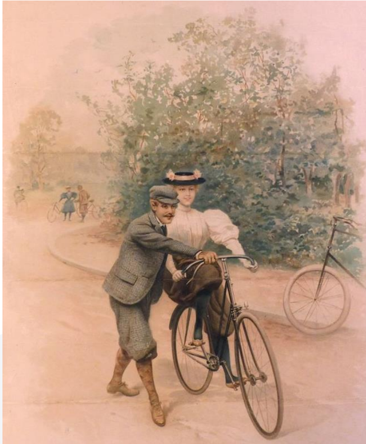
Un homme apprend à une femme à faire du vélo, estampe polychrome, vers 1900, estampe polychrome, AD14, 17FI/1390