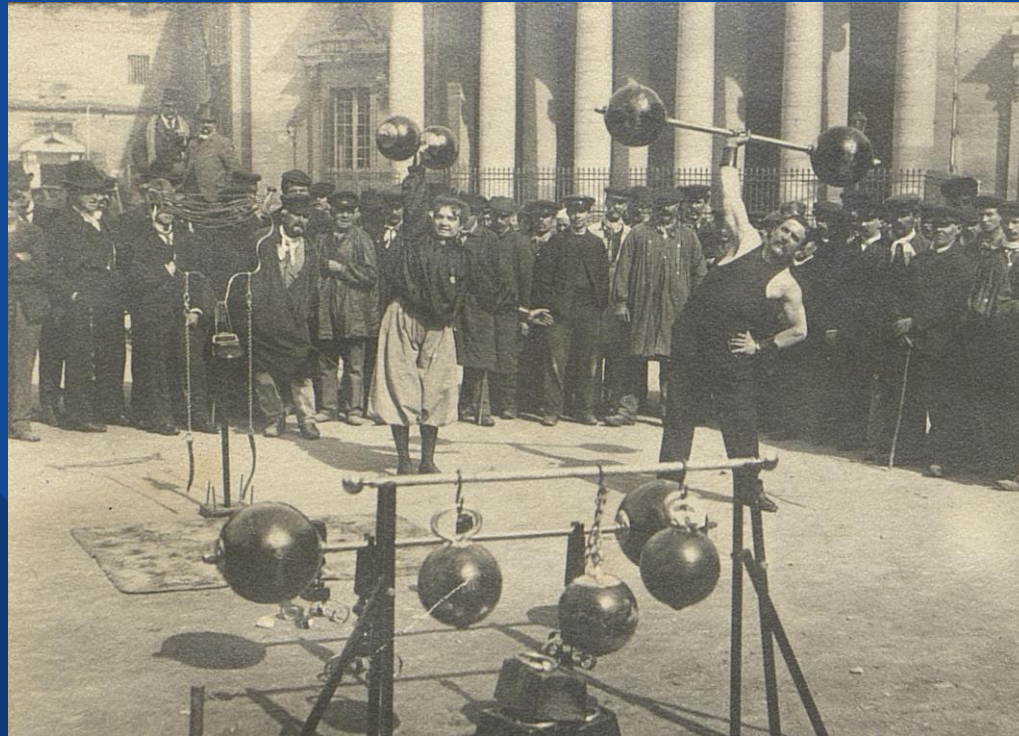
Démonstration d'haltérophilie place Fontette à Caen vers 1902