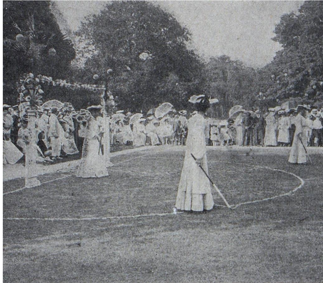
Match de hockey-sur-gazon à Riva-Bella, in La Perle de la Manche , 31 janvier 1905, AD14, F/5406