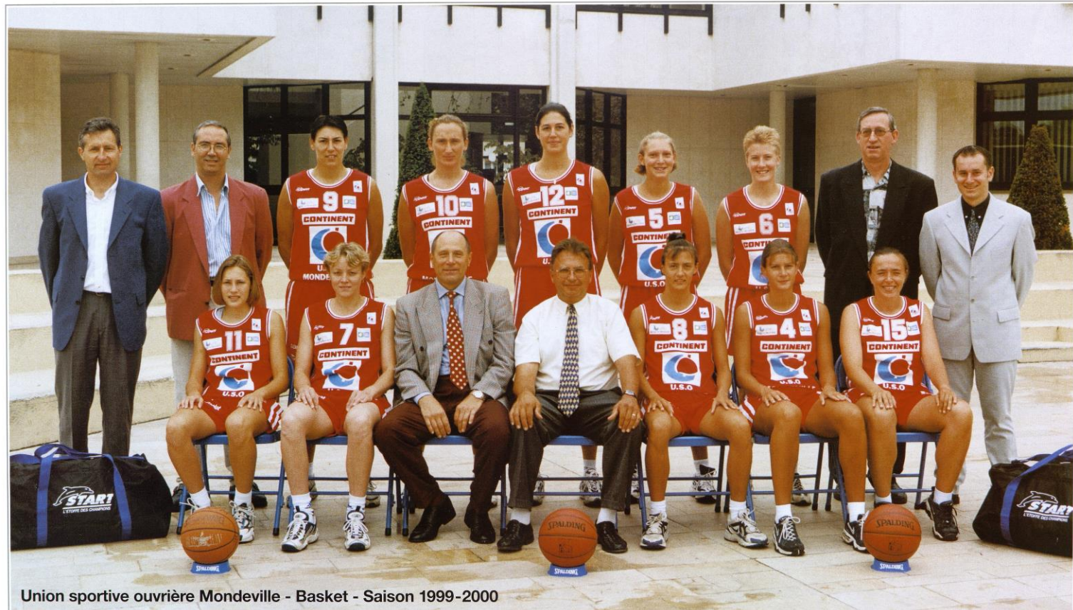
Union sportive ouvrière Mondeville - Basket - Saison 1999-2000

USO Mondeville - Saison 1999-2000 - Allez les filles !