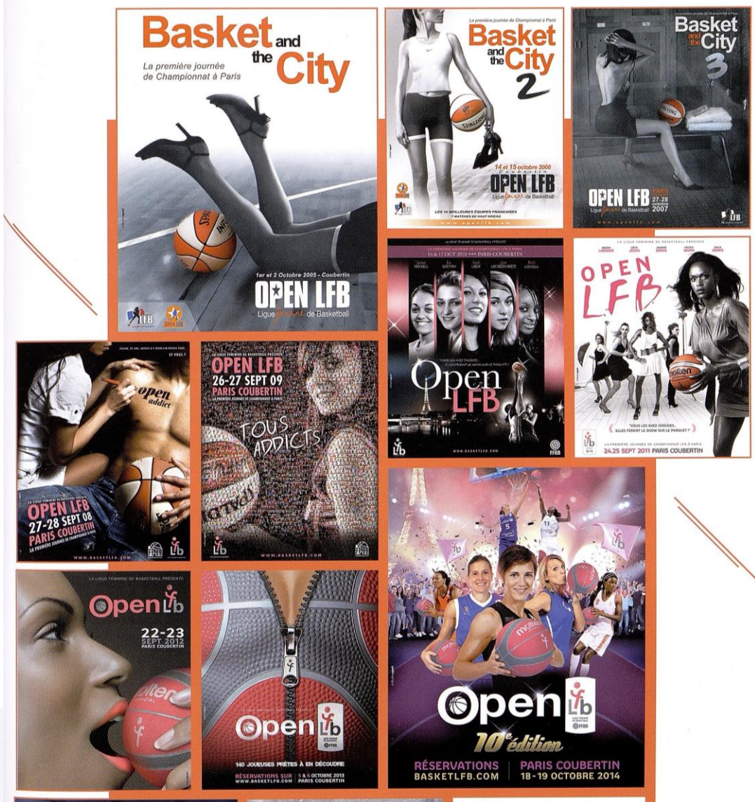
Livre des 20 ans de la Ligue Féminine de Basket, 1998-2018, éd. FFBB, 2018, couverture et p. 65