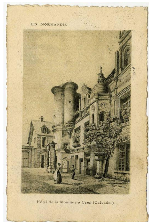
Hôtel de la Monnaie à Caen. Sans date (18FI_115/1919)